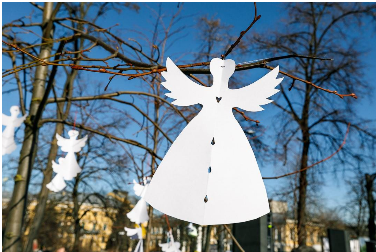
Ангели на алеї героїв Небесної Сотні.