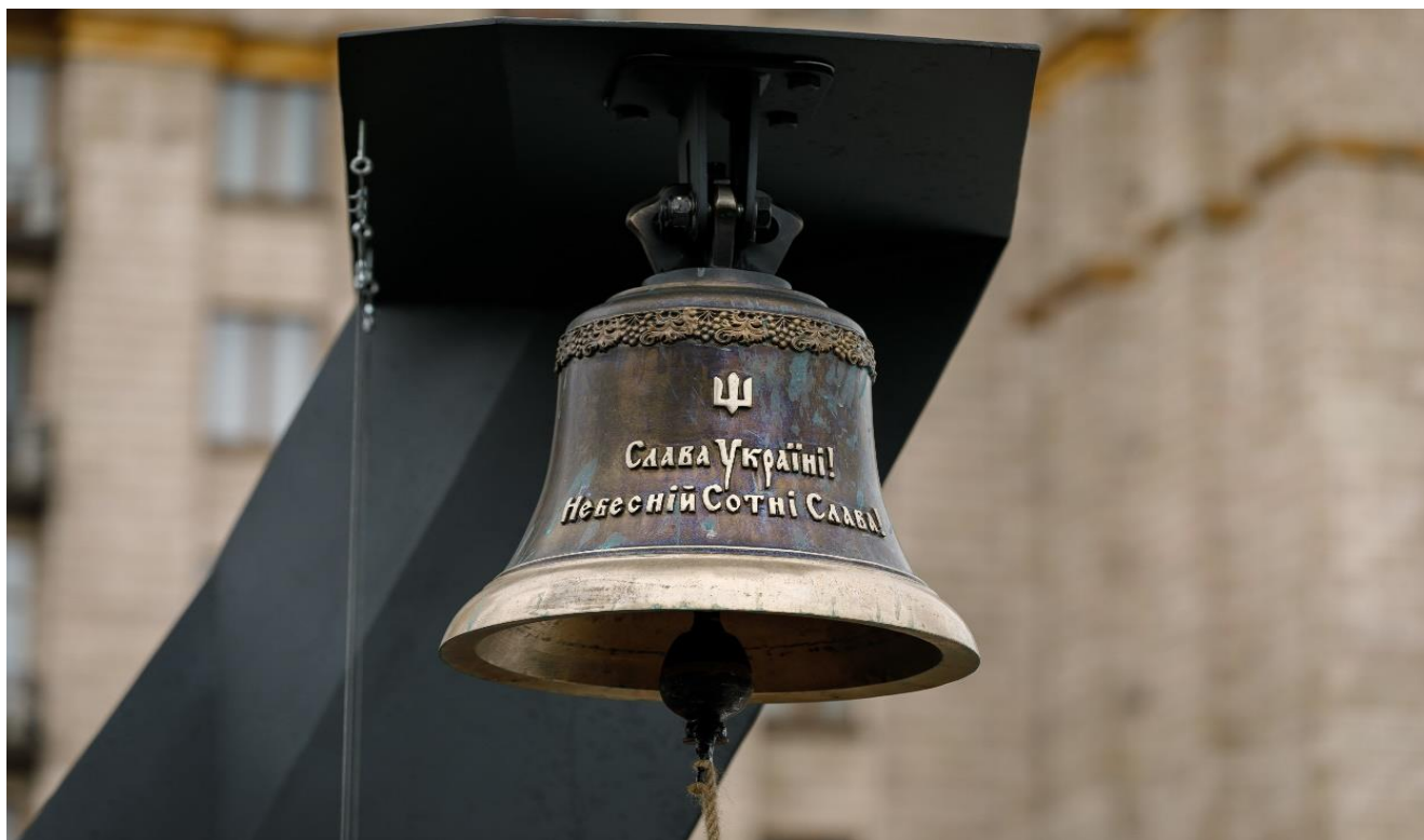
Дзвін Гідності на алеї Героїв Небесної Сотні у Києві.

Персональне вшанування кожного з Небесної Сотні є важливою практикою інституалізації суспільної пам'яті про події Революції Гідності, розширення загальнодоступних форм пошанування пам'яті загиблих, що слугує зокрема впровадженню в суспільстві моральних імперативів, гідних поваги та наслідування. Більше інформації за посиланням.