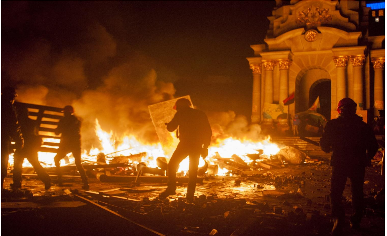
Ніч 19 лютого на майдані Незалежності.

О третій ночі барикаду на Хрещатику з боку Європейської площі було зруйновано, а від Будинку Федерації профспілок України до монумента Незалежності простягалася вогняна барикада.