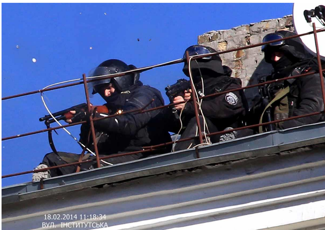
Силовики на дахах урядового кварталу ціляться в учасників «мирного наступу».

Об 11-й годині між мітингувальниками та спецпризначенцями почалися сутички. Для протидії протестувальникам силовики застосували світлошумові гранати (за деякими даними, з прикріпленими залізними деталями для збільшення руйнівної сили), травматичну та стрілецьку зброю, а також активно залучали тітушок, підтримуючи відверто протиправні дії членів неформальних угруповань. Учасники протесту й журналісти повідомляли про стрільців із рушницями, яких помічали на дахах будівель і вулицях урядового кварталу.