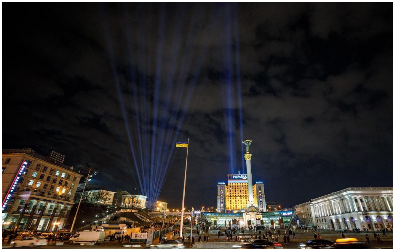
Промені Гідності. Світлина з медіаархіву НМРГ

До другої річниці створення Музею, 18 листопада 2017 року, світлову інсталяцію розмістили на місці майбутнього меморіально-музейного комплексу. До початку широкомасштабного вторгнення росії в Україну щороку 20 лютого під час відзначення Дня Героїв Небесної Сотні на знак пам'яті про загиблих учасників Революції Гідності на алеї Героїв Небесної Сотні Музей запалював 107 променів. Під час режиму воєнного стану з огляду на безпекові заходи промені не запалюють.