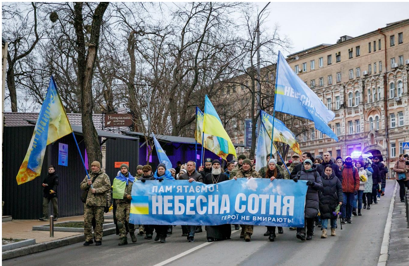
Щорічна хода пам’яті.

ветеранів російсько-української війни, громадських активістів і всіх небайдужих громадян. Це зокрема традиційні молебні, панахиди за героями біля Екуменічного храму Архистратига Михаїла та Українських Новомучеників і хреста на алеї Героїв Небесної Сотні, у Михайлівському Золотоверхому соборі, щорічні акції “Різдво для Героя”, “Великдень для Героїв», хода пам’яті.