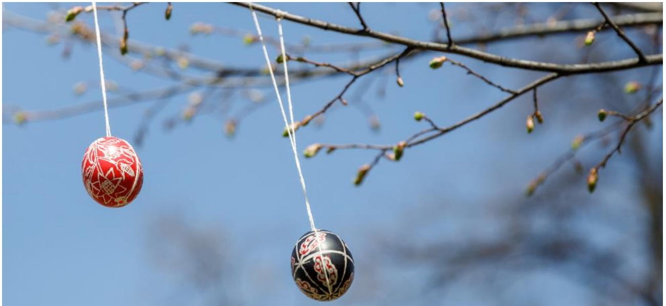
Великодні символи на алеї Героїв Небесної Сотні.

Акцію “Різдво для Героя” було ініційовано родинами Героїв Небесної Сотні. У межах заходу для вшанування загиблих до пам’ятних місць кладуть різдвяні вінки, сплетені напередодні.