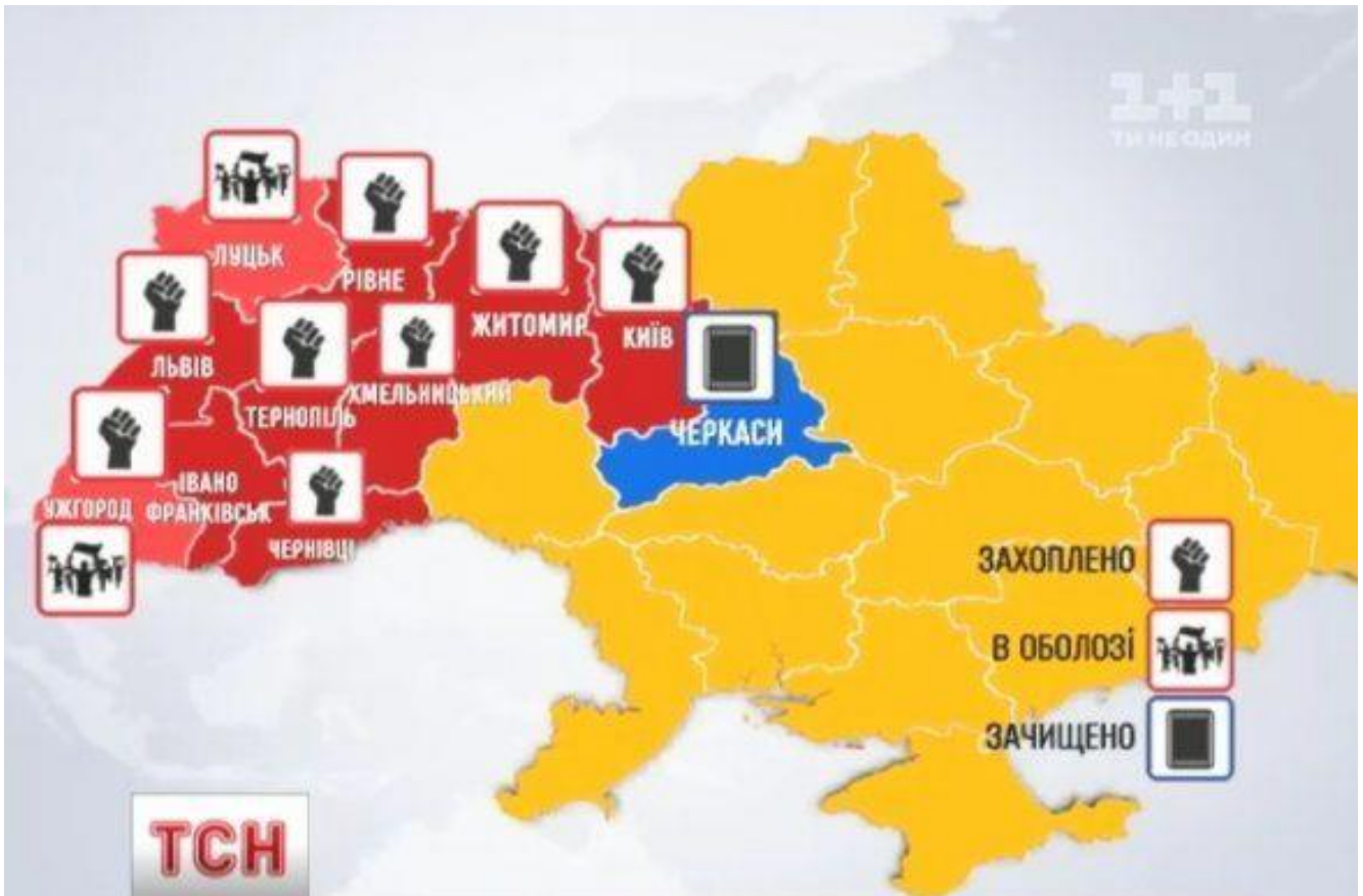
Карта України з позначенням міст, в яких активісти взяли під контроль будівлі державних адміністрацій, станом на 24 січня 2014 року.