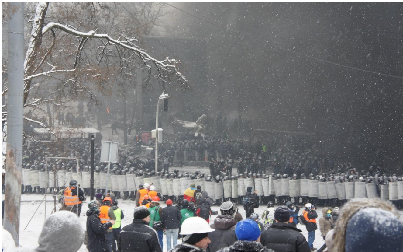
Вулиця Грушевського 22 січня 2014 року.

наступу. Боротьба вийшла на новий етап, кульмінацією якого стали події 22 січня 2014 року .