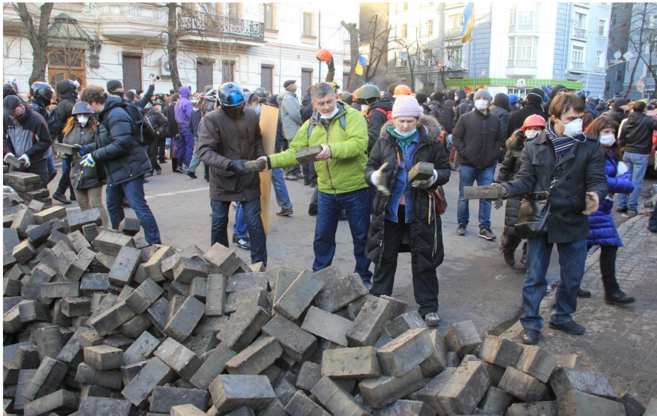
Зведення барикад на вул. Інститутській 18 лютого.